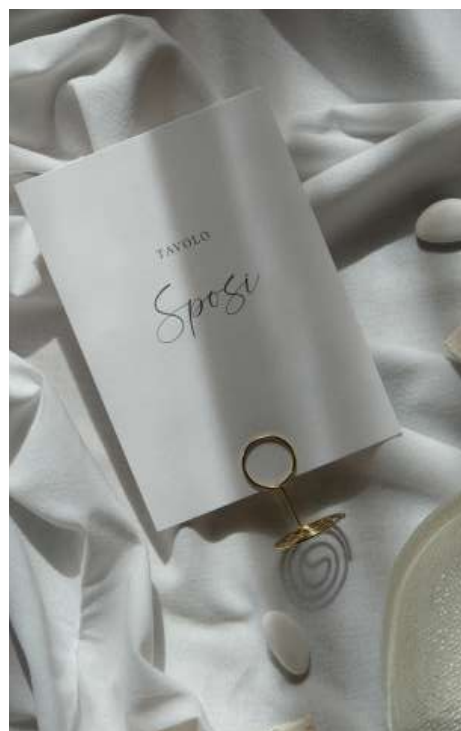
Tableau de mariage in cartoncino bianco 250 gms, Country Chic con supporto dorato

POKART, oltre alla realizzazione del tableaux mariage, in cartoncino o POKARTA, e secondo lo stile del coordinato, si offre di aiutare la coppia nella ricerca del supporto più adatto per il suo sostegno. Il tableau de mariage si completa con il nome del tavolo, da appoggiare su di esso, come si può vedere nella foto.