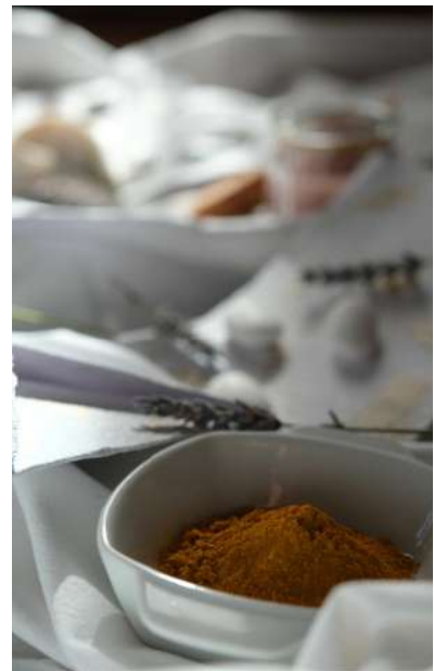
Pigmento Terra di Siena