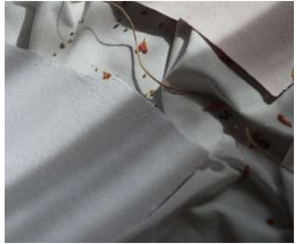
Calma Natural e Color Cipria

La POKARTA Calma viene asciugata su un materiale liscio, tendenzialmente di cotone. Ciò fa sì che la carta risulti liscia, uniforme, senza increspature.