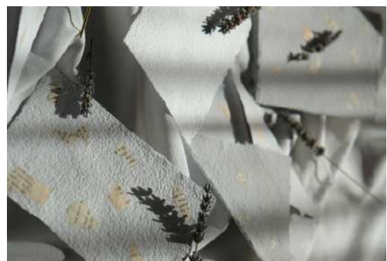
Vivace Book Natural