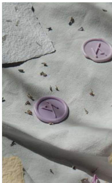
Sigilli 3D monocromi e carta Vivace Natural Color Sabbia con lavanda