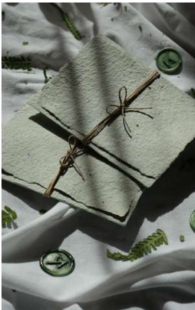
Vivace Color Salvia

POKARTA Color é una carta riciclata da carta colorata oppure realizzata grazie all'aggiunta di pigmenti colorati naturali. È perfetta per essere abbinata ad ogni gusto ed evento. I colori possono variare nelle sfumature e sono sempre un work in progress : hai un colore che vorresti? Proviamo a crearlo insieme!