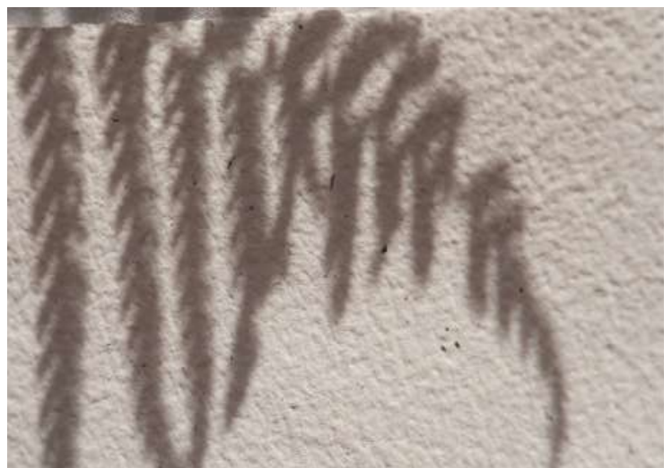
Vivace Color Avorio