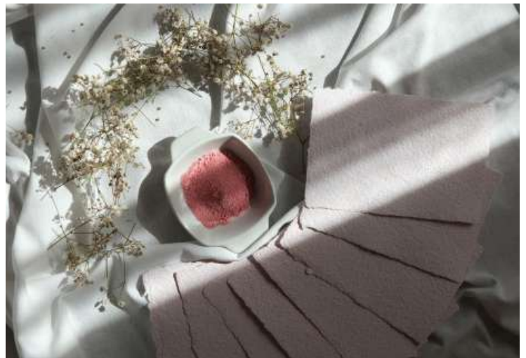
Vivace Color Cipria