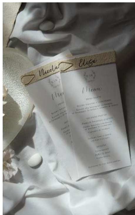
Menù in cartoncino bianco e tag in carta Vivace Avorio, uniti da una graffetta dorata

Il menù del ricevimento racconta agli ospiti il viaggio culinario che stanno per affrontare. Può essere uno o più di uno appoggiato al centro del tavolo, da condividere tra gli ospiti, oppure singolo per persona, appoggiato sul tovagliolo o sul piatto, spesso abbinato al tag del nome, qualora si assegni un posto a ciascun ospite. Se, invece, si preferisce assegnare solo il tavolo all'ospite e non un posto specifico, il tag del nome può essere lasciato in corrispondenza del tableau mariage all'ingresso nella sala e lasciare che ogni ospite trovi il suo nome e si scelga il suo posto. Grazie al segnaposto ciascun invitato saprà ritrovare la sua postazione nel corso del ricevimento, ma non è obbligatoria. In ciascuno dei casi vi è un segnaposto e un menù adatto: che lasci il posto per il tag fissato con una graffetta, oppure uniti grazie ad un fiocco, o un sigillo in cera, composti da una combinazione di cartoncino e POKARTA, oppure tutto in carta fatta a mano.