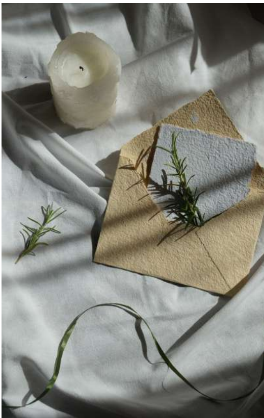
Vivace Color Sabbia e Naural

Per realizzare la POKARTA Vivace vengono utilizzate superfici porose. Ciò permette alla carta di assumere una sembianza ondulata, viva, increspata al tatto.