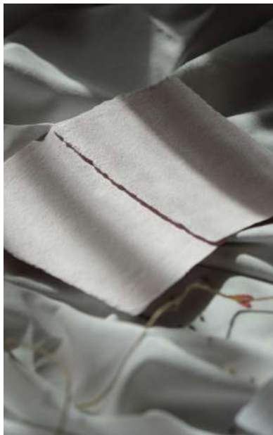
Calma Color Cipria