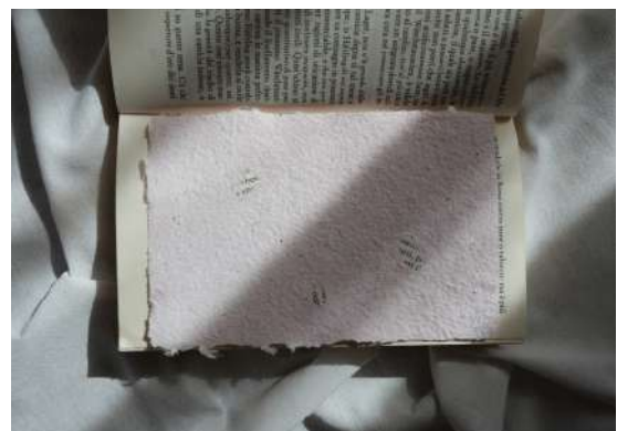
Vivace Book Cipria

Così, alle tipologie natural o color, vengono aggiunti dei frammenti di pagine di un libro importante per te e la tua storia. Può essere un grande classico, dell'infanzia, un romanzo o un testo sacro. Insieme decideremo, quanto rivelare del libro scelto, se intere frasi, poche parole, o lasciare che sia solo la sua anima, a vibrare nella materia.