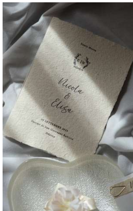
Libretto Vivace Color Avorio, Country Chic con rilegatura invisibile

Nella progettazione del libretto è importante considerare lo stile del rito, e perciò mantenere uno stile coerente, ma anche degli elementi più pratici, come la comodità nella presa e la facilità di lettura. Per questo motivo, la personalizzazione del libretto è limitata alla copertina e alla rilegatura. I fogli interni sono solitamente stampanti in carta bianca 80 gsm, mentre la copertina, realizzata in POKARTA, si allinea al coordinato scelto. La rilegatura, realizzata a mano, può riprendere il nastro utilizzato negli altri elementi, oppure essere realizzata con cucitura "invisibile" bianca o colorata: per questa tipologia viene adoperato un filo molto sottile, che risulta quasi trasparente.