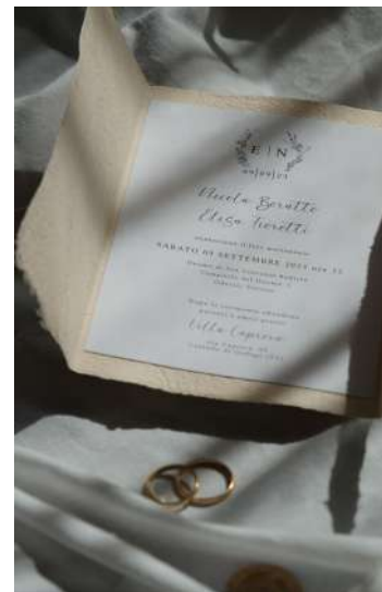
Partecipazione Country Chic con logo