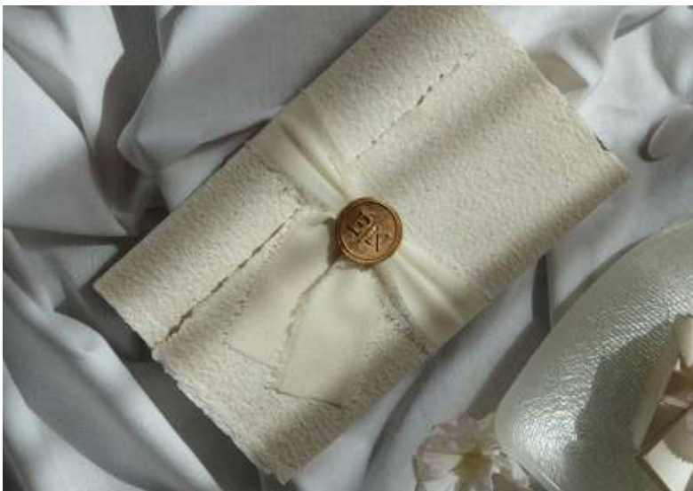
Partecipazione con busta a portafoglio, nastro in chiffon avorio e sigillo 3D

Per fare ciò, si può scegliere tra diversi modelli, alcuni più formali, altri più scherzosi, nello stile e nella forma: sono a disposizione buste a portafoglio, tradizionali, quadrate, a lettera. Lo stesso vale per la grafica, come già anticipato a pagina 7, POKART mette a disposizione 4 modelli gratuiti tra cui scegliere. Oltre a ciò è possibile effettuare qualsiasi modifica ai modelli oppure creare un nuovo modello partendo da zero.