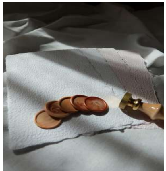
Mossa Ecopelle Natural e Color Cipria

È però un procedimento più lento, poiché per la sua realizzazione richiede del tempo in più.