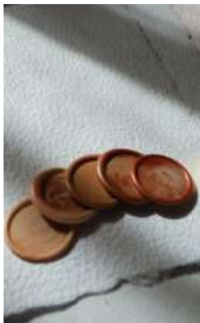
Sigilli standard variegati e carta Mossa Ecopelle

Tra le proposte di POKART vi sono i sigilli in cera. I sigilli standard, dal timbro circolare piatto, possono essere di due diametri, monocromi o variegati e personalizzati con altri elementi quali dettagli floreali o foglia oro, argento o bronzo. I sigilli 3D, sono realizzati grazie ad una stampa 3D del disegno che si desidera imprimere nella cera: possono rappresentare le iniziali della coppia, un simbolo o una breve frase (es: with love). Qualora non sia possibile stampare in 3D il disegno desiderato, ci si avvalerà di un fornitore esterno che procederà alla realizzazione di un timbro classico in ottone.