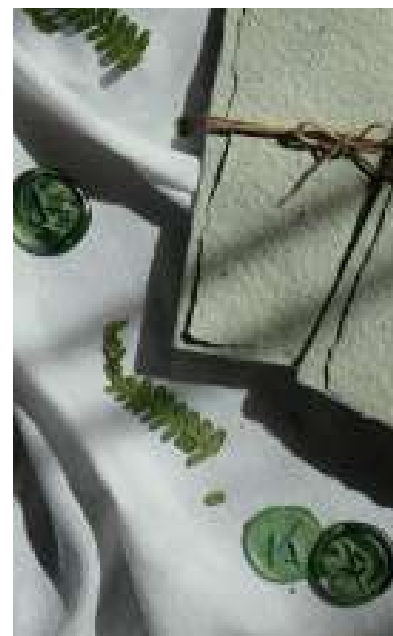
Sigilli 3D variegati e carta Vivace Natural Color Salvia e spago